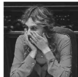
MINISTRO Marianna Madia

La situazione resta comunque complicata a prescindere dalla sentenza della Consulta e il clima infuocato della battaglia referendaria non aiuta. Anche per questo ai sindacati non spiacerebbe rimandare ogni discussione a dopo il 4 dicembre. A quel punto si potrebbe ritrovare la serenità necessaria per affrontare i nodi veri della trattativa: l'estensione dell'intesa alla scuola, e l'aumento di 85 euro che il Governo vorrebbe come aumento medio mentre il sindacato lo indica come minimo.