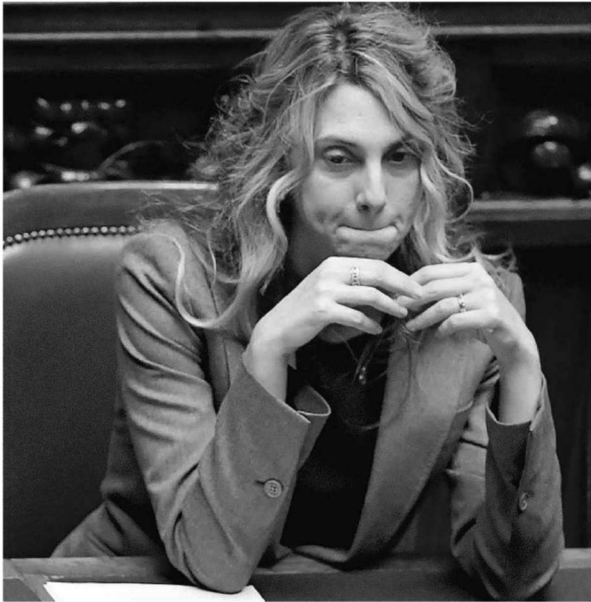
ACCIGLIATA Il ministro della semplificazione e della pubblica amministrazione, Marianna Madia