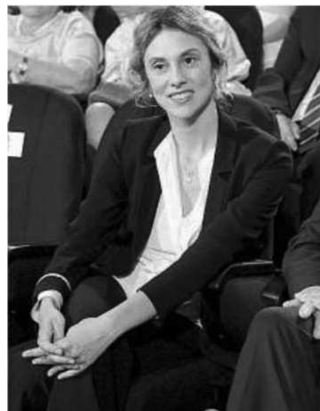
Vertice Mercoledì il ministro Marianna Madia incontrerà i sindacati per chiudere l'intesa sul rinnovo dei contratti ai dipendenti pubblici

Le ipotesi L'esecutivo deve scegliere se concludere la trattativa o rinviare al dopo-voto sulle riforme