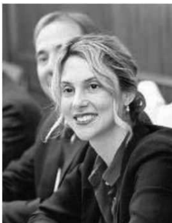
Marianna Madia, ministro della Pubblica amministrazione